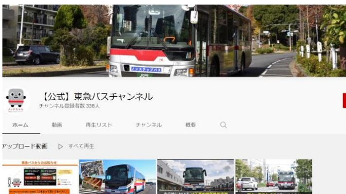
▲YouTube「東急バスチャンネル」にて配信