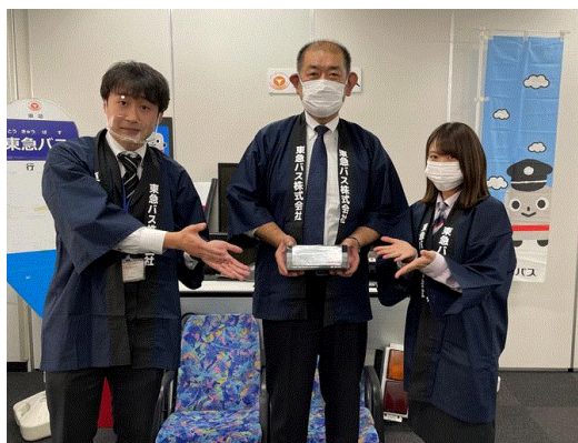
▲注目グッズの紹介動画