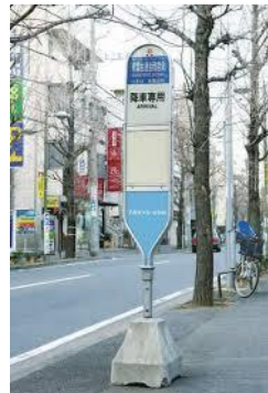
お貸しできるバス停(本体) 例（有償）