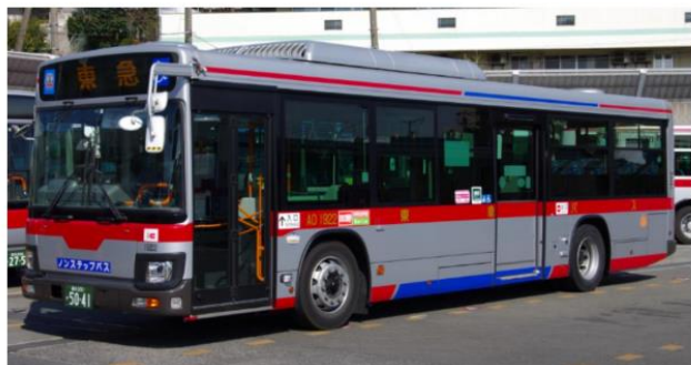
路線バス大型車両一例

一般路線大型バス…立ち含め約60～70名様程がご乗車可能（正座席20～30席程度）