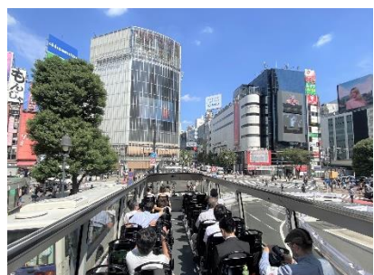
オーブントップバス（渋谷）