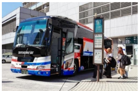
高速バスターミナル（渋谷）