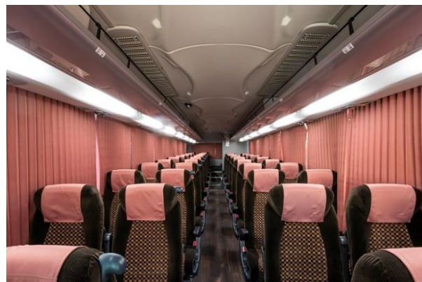
「Satellite Biz Liner」 使用車両 (38人乗り)