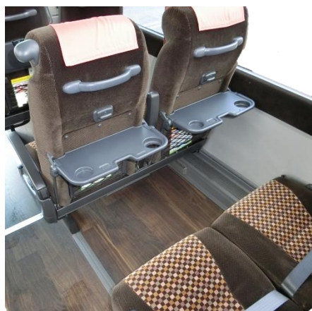
快適に過ごすことができる広々としたシート