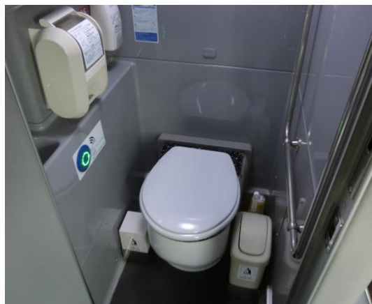
化粧室完備で長時間の移動も安心