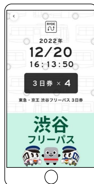
チケット画面イメージ