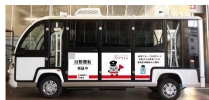
▲使用する自動運転バスのイメージ