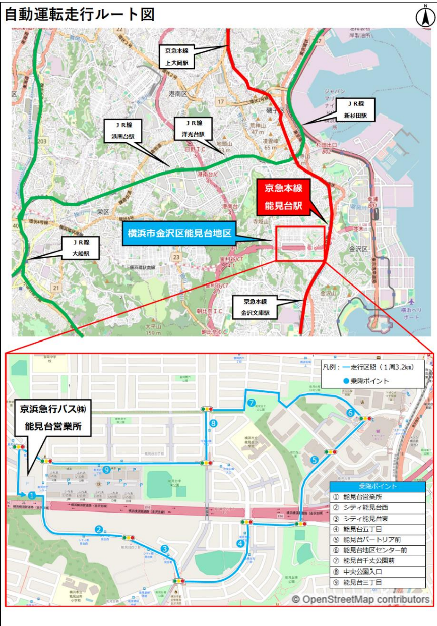
自動運転走行ルート図