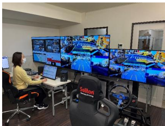
▲遠隔コントロールセンターのイメージ

(参考)この資料は本日、国土交通記者会、ときわクラブ、横浜経済記者クラブ、横浜市政記者室、川崎記者クラブに配布しています。