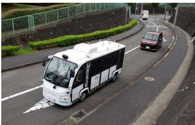
▲昨年9月の実証実験の様子