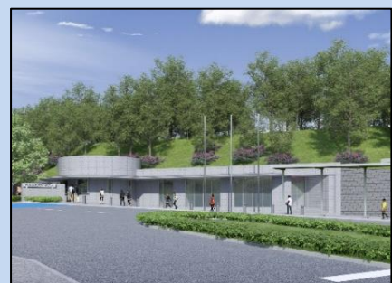
待合施設のイメージ図

学校法人日本体育大学にて、日本体育大学横浜・健志台キャンパスの交通広場に、バリアフリー対応の待合施設（冷暖房完備、トイレ併設）を整備しています。（令和6年3月末竣工予定）