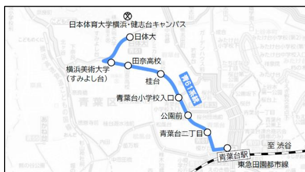
青61系統路線図（令和6年4月1日～）

東急バス青61系統は東急田園都市線の青葉台駅と日本体育大学の横浜・健志台キャンパスを結び、学生や沿線住民の方など大変利用者の多いバス路線です。このたび、当路線へ連節バスを導入し、輸送力を確保しつつ、利便性を維持しながら、運行便数を最適化するとともに、快適でスムーズな輸送サービスの提供を目指します。