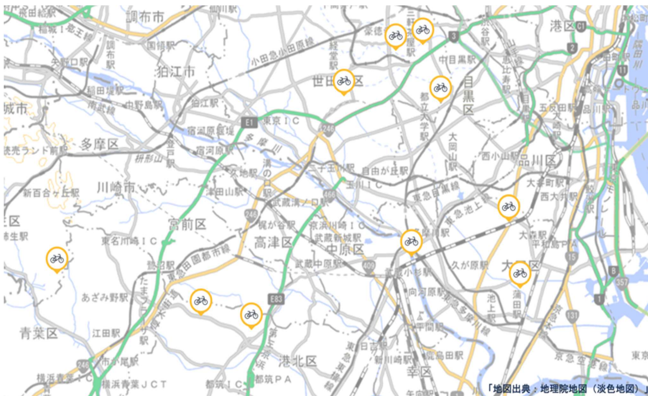
開設ステーション MAP