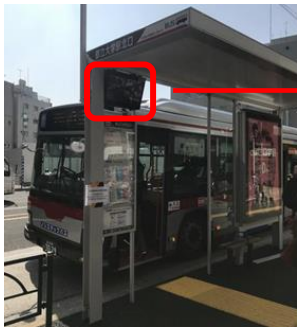
(都立大学駅北口バス停)