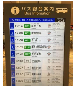
（青葉台駅 65 インチ 4K ディスプレイ）