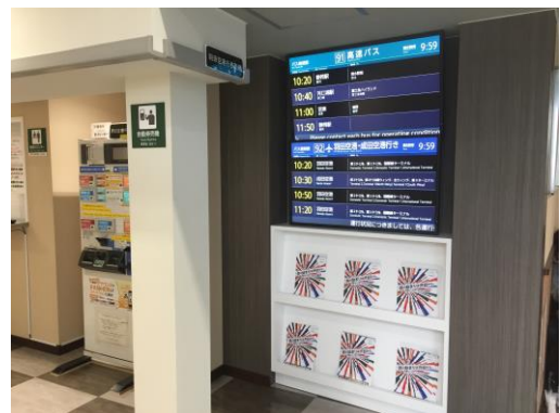
（渋谷マークシティBT 待合所）