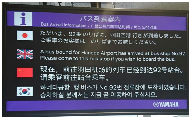
(デジタルサイネージ表示イメージ)

※1 ヤマハ株式会社が開発した、言語や聴力の壁を超えて誰もが確実にアナウンスの内容を理解することができる「音のユニバーサルデザイン化支援システム」です。ヤマハではサービスを通じて外国人観光客や高齢者、聴覚障害者にも優しい社会の実現を目指しています。詳細は「おもてなしガイド」ウェブサイト： http://omotenashiguide.jp をご覧ください。