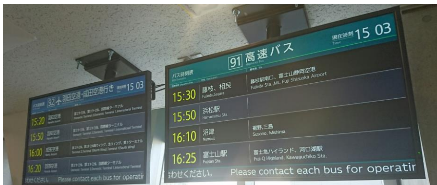
(デジタルサイネージ表示イメージ)