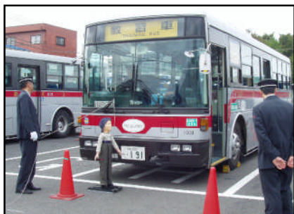
▲運転席体験（死角の確認）