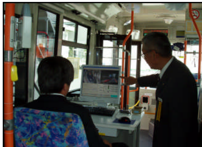
▲「安全運転訓練車」体験