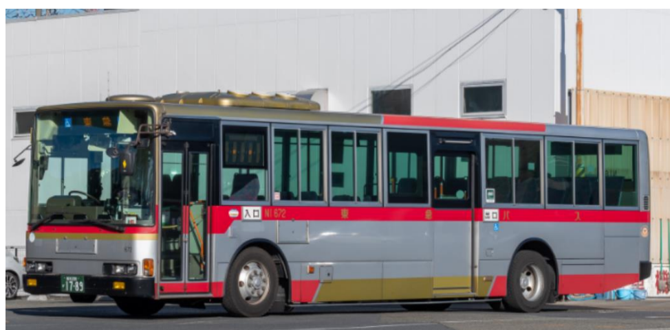
ロマンスシートタイプ車両一例

ロマンスシートタイプ …中距離用に前向きにシートが設置された車両です。 立ち含め約50～60名様程がご乗車可能（正座席40～50席程度）