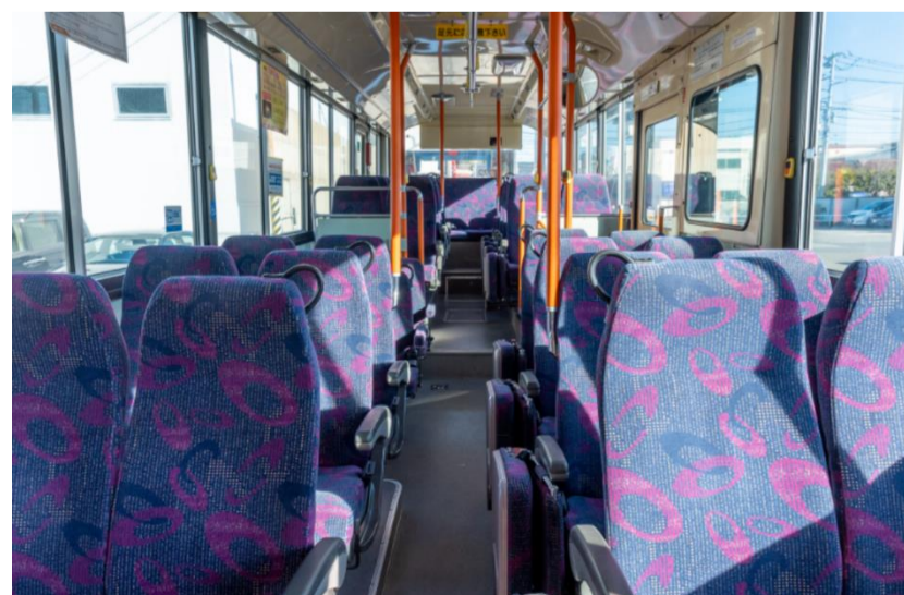
ロマンスシートタイプ車内一例