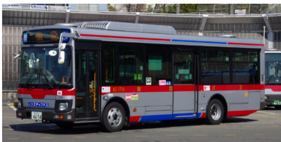
路線バス中型車両一例

一般路線中型バス …立ち含め約50～60名様程がご乗車可能（正座席20～27席程度）