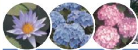
太田吉沢ゆりの里