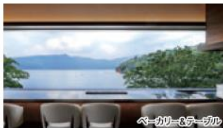
ベーカリー&テーブル