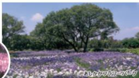
あしかがフラワーパーク