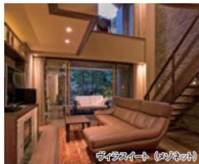
ヴィラスイート (メゾネット)