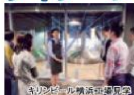
キリンビール横浜工場見学