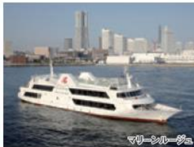
マリニールージュ