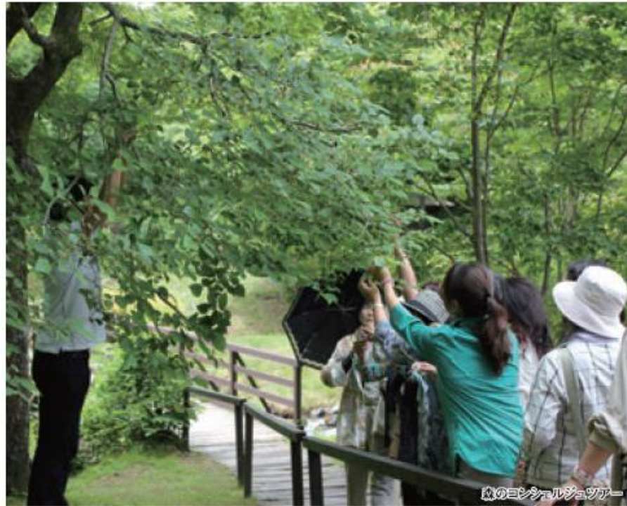
森のコンシェルジュツアー