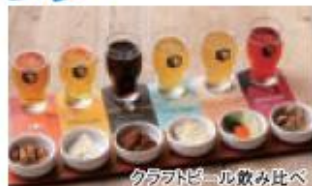
クラフトビール飲み比べ