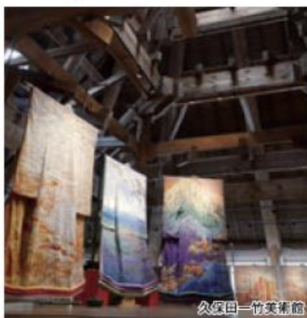
久保田一竹美術館