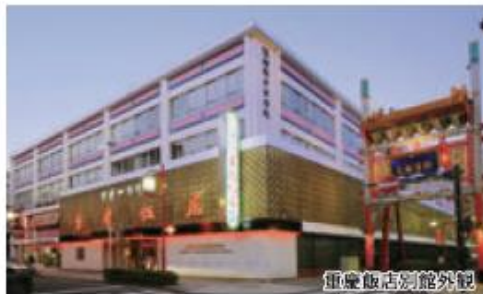
重慶飯店別館外観