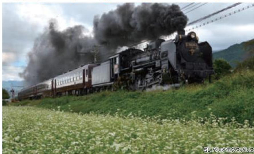
SLパレオエクスプレス